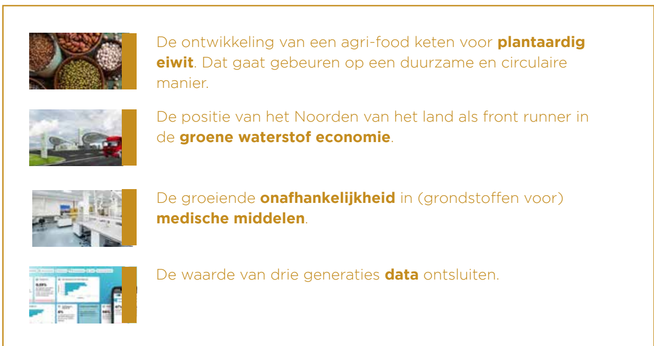
Figuur 1. Enkele initiatieven die kunnen fungeren als Drivers for Growth voor de regio

Inspirerende voorbeelden van actuele ontwikkelingen op basis van de Drivers for Growth zijn er te over.